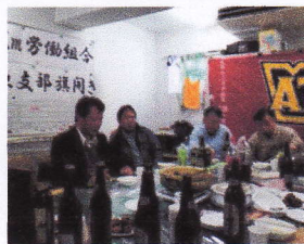
台東支部の旗開き