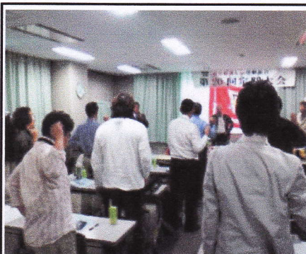
第20回定期大会 団結ガンパロー