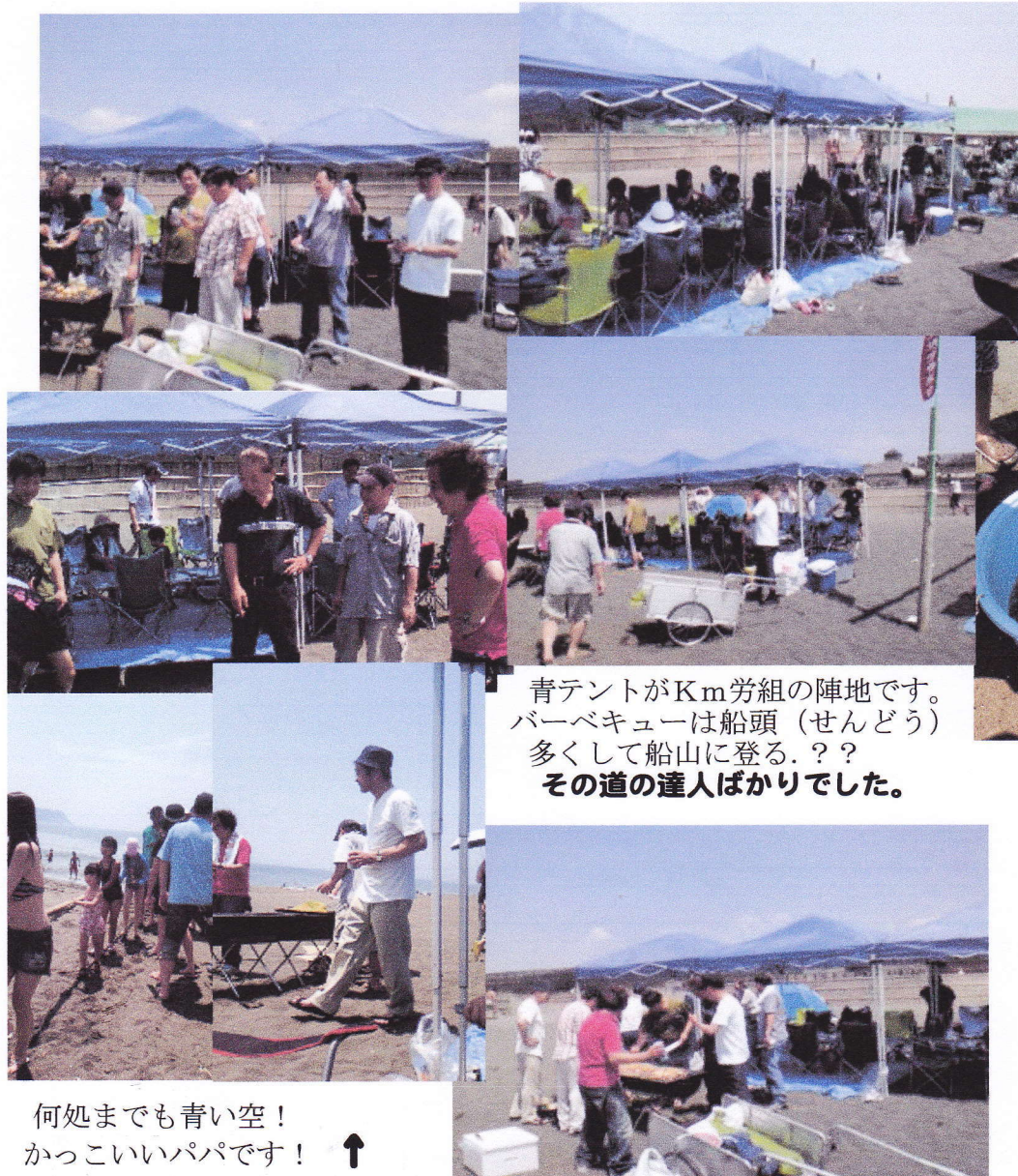
青テントがKm労組の陣地です。 バーベキューは船頭（せんどう） 多くして船山に登る。?? その道の達人ばかりでした。