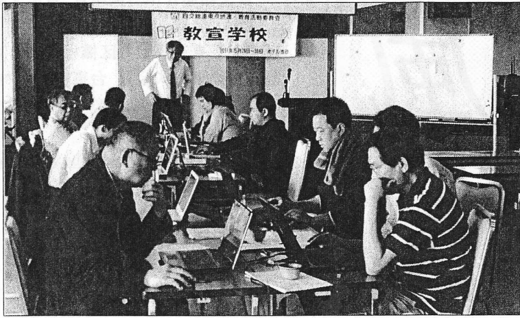
真剣な表情でパソコンと格闘する参加者達 ホテル池田(熱海)会議室にて